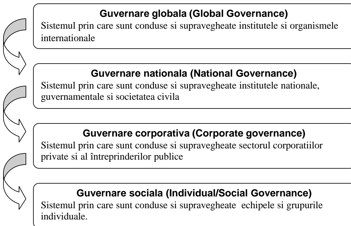
Figura 2. Complexitatea procesului de guvernare

În acest context, conceptul de guvernare capata dimensiuni noi. Guvernarea globala trebuie sa gaseasca raspunsuri la probleme din ce în ce mai complexe, începând cu problemele natiunilor foarte sarace ale lumii care se confrunta cu saracia, foamea, lipsa apei, educatia si injustitia sociala etc, pâna la problemele natiunilor bogate: coruptia, somajul, poluarea etc. Cu toate ca se au în vedere drepturile privind participarea la guvernare, în sensul strict guvernarea nu este sinonima cu dreptatea sociala sau democratia, pentru exprimarea acestor principii a aparut conceptul de „buna guvernare”