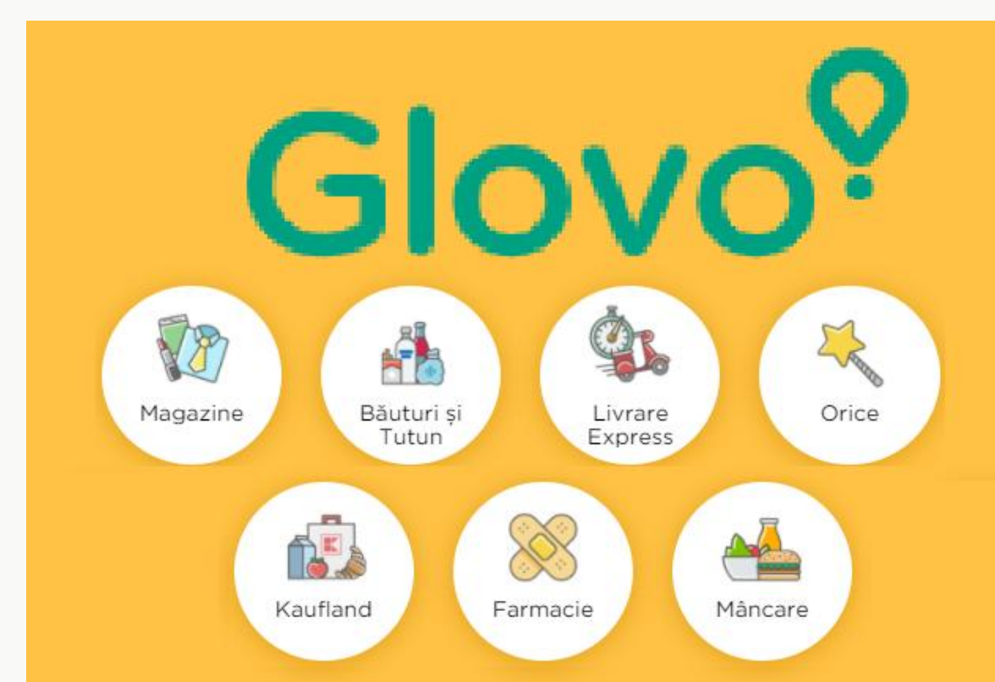
Figura 3. Captură de ecran din aplicația Glovo cu butoane active pentru plasare comandă

- Câștigul GLOVOAPP SRL rezultă din comisionul pe care îl ia de la furnizori parteneri și din taxa de livrare de la clientul final.